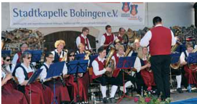
Die Stadtkapelle beim Tag der Blasmusik im vergangenen Sommer.