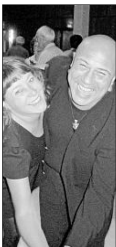
Bei der Oldie-Tanznacht mit den „Rough Roads“ herrschte eine ausgelassene Stimmung in der Singoldhalle.